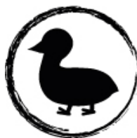
And, gås, fasan