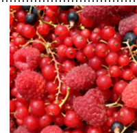
Mørke modne bær