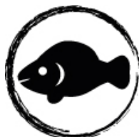
Lys fersk fisk