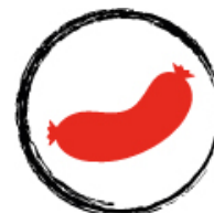
Krydrede pølser og salami