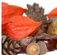
Kraftige vilde bær