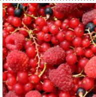
Mørke modne bær