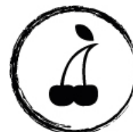
Frisk frugt - især jordbær